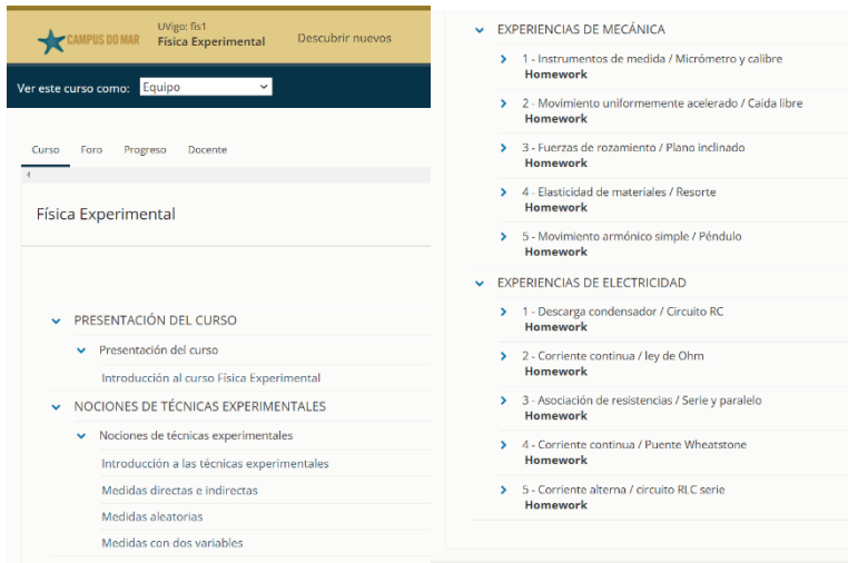
Figura 2. Contidos do curso MOOC Física Experimental ( https://mooc.campusdomar.es/ )